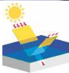
ODPORNY NA EKSTREMALNE WARUNKI POGODOWE