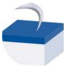
ODPORNY NA ZADRAPANIA