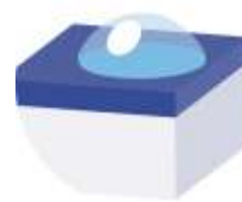
ŁATWY W PIELEGNACJI